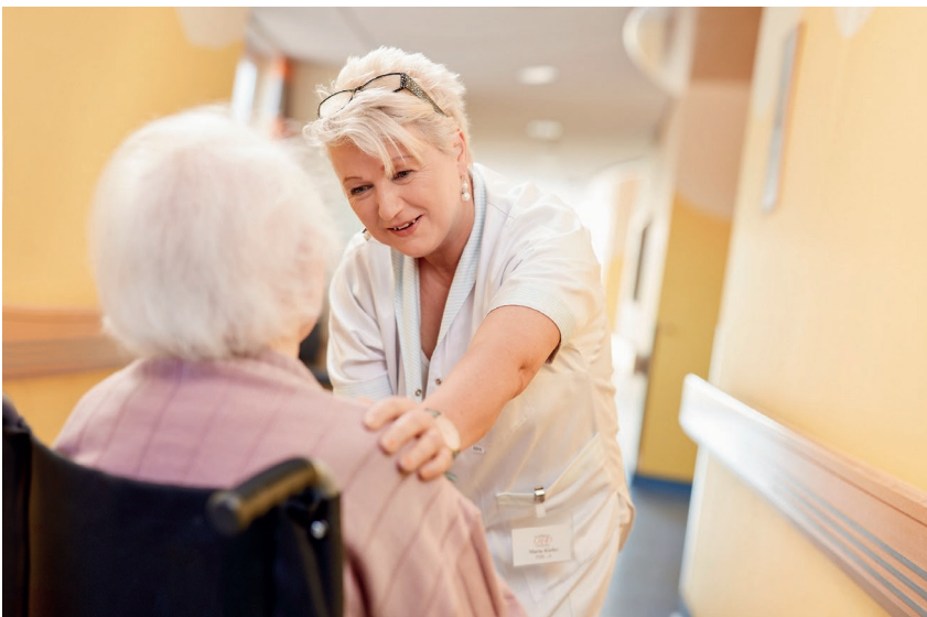
Drei Viertel der Altenpfleger/-innen glauben nicht, bis zur Pension durchzuhalten

Hohe Arbeitsbelastungen wirken sich negativ auf die Arbeitsfähigkeit älterer Beschäftigter aus. Fast die Hälfte der Beschäftigten über 45 hat Sorge, bis zur Pension durchzuhalten.