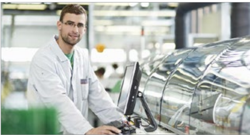
Beschäftigte in IT-Branche sind männlich, jünger und gut qualifiziert.

Der immer schnellere digitale Wandel bringt neue berufliche Chancen, aber auch Belastungen durch Zeitdruck, Stress und schlechten Führungsstil.