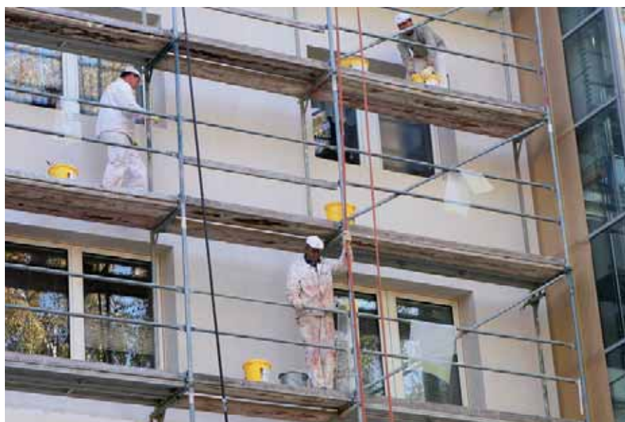
Nur gedämpfter Optimismus nach der Krise.

Aktuelle Ergebnisse und Hintergrundinformationen finden Sie auch unter www.arbeitsklima.at . Dort steht auch die umfangreiche Arbeitsklima Datenbank für Auswertungen zur Verfügung