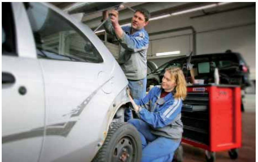
Jeder-r zehnte Beschäftigte verdient nicht mehr genug zum Leben.

Für 15 Prozent der Arbeiter und für 12 Prozent der Freien Dienstnehmer/-innen entspricht das Einkommen nicht mehr den Lebensbedürfnissen. Auch bei den Migranten/-innen ist die Armutsgefahr gravierend – bei 15 Prozent reicht das Einkommen nicht zum Leben.